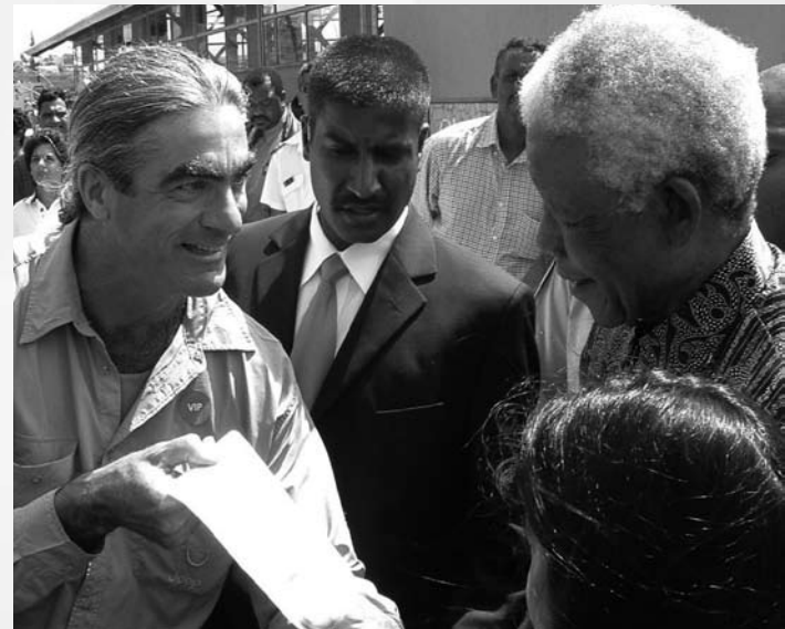
Jean Béliveau a Nobel-békedíjas Nelson Mandelával is találkozott.