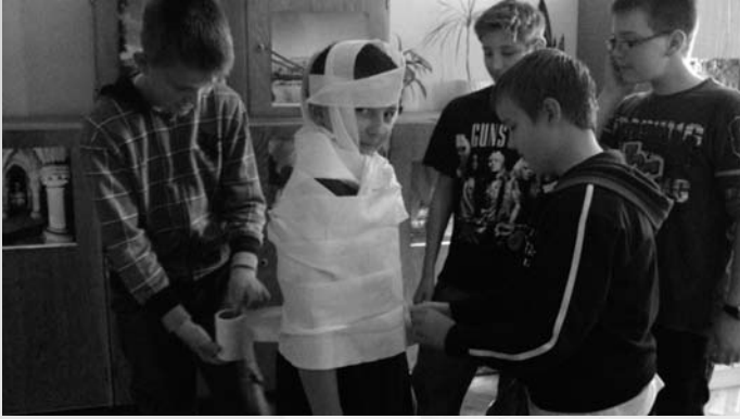
Halloweenparty a suliban

2013. október 4-én Jean Bélivau az iskolában