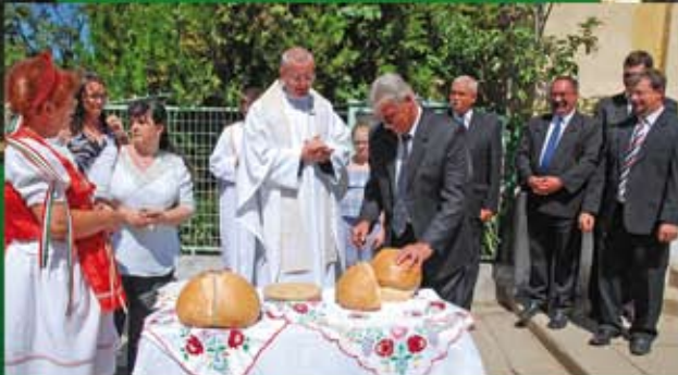
Új kenyér ünnepe