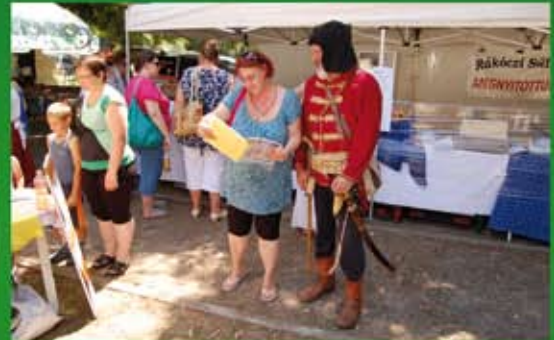
Hagyományörző fesztivál /Aratófalatok/