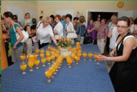
Közsféra dolgozóit köszöntöttük