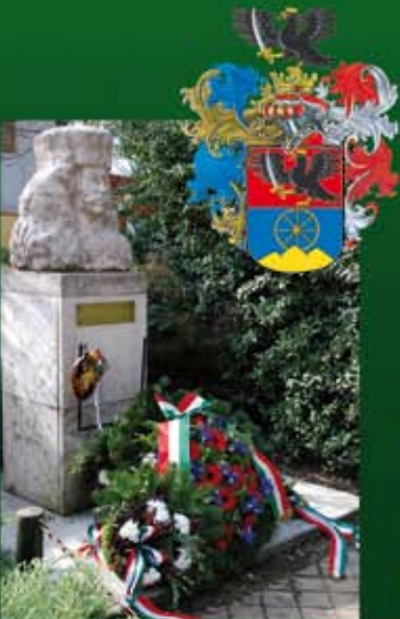
II. Rákóczi Ferenc születésnapja