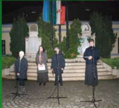
Emlékezés a doni áldozatokra