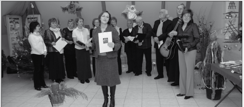
Mindenki karácsonya (civilszervezetek összefogásával)

De számtalan arcul csapást kap a macimúzeum is. Öt évvel ezelőtt megnyitotta kapuit, azóta folyamatosan fejlődnek, rendszeresen kiállításokat szerveznek, próbálják a kulturális értékeket a település lakóihoz a legközelebb vinni. Mindezért cserébe számára vette a „falu”, mit akar „balázstóni” a macijával, mibe kerül ez az önkormányzatnak? A pocskondiázók egy része talán még nem is járt az épületben. Rajtuk kívül tett-e bárki is valamilyen maradandó értéket a település kulturális életében? Nézzünk szembe a tényekkel! Ha idelátogatnak vendégek, a településen mit tudunk megmutatni a Macimúzeumon kívül, amelyik még vasárnap is nyitva tart? Szerintem ne gondolkodjanak sokáig, mert a templomon, a Varsányi közösségi házon és a Tisza parton kívül más nem jut az eszükbe. Ezért érthetetlen, ha van egy kis csapat, akik dolgoznak, alkotnak, akkor azt miért nem ismerjük el, a méltatlan bántások helyett