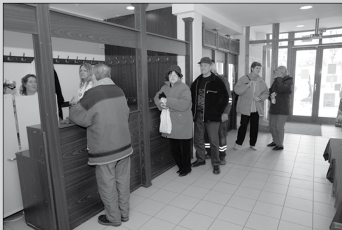
Tüdőszűrés a Varsány Községi Házban