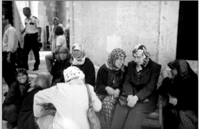
Mevlana - múzeum udvara