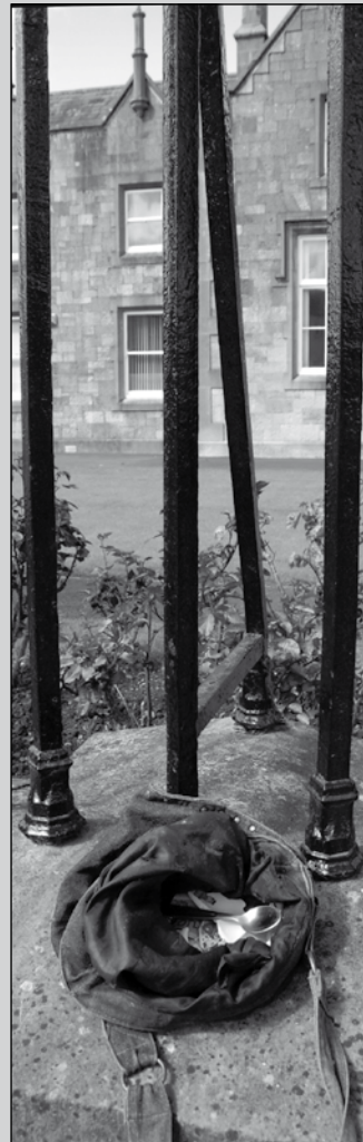
Virradat - Kilkenny

Az oldalt összeállította és a fotókat készítette: Papp Imre