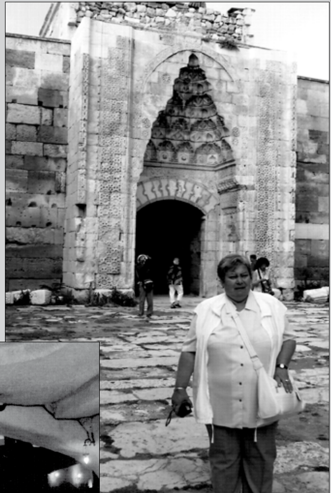
Sultanhani - Karavánszeráj