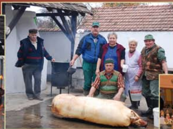
Hagyományos disznóölés és disznótör Rákóczifalván