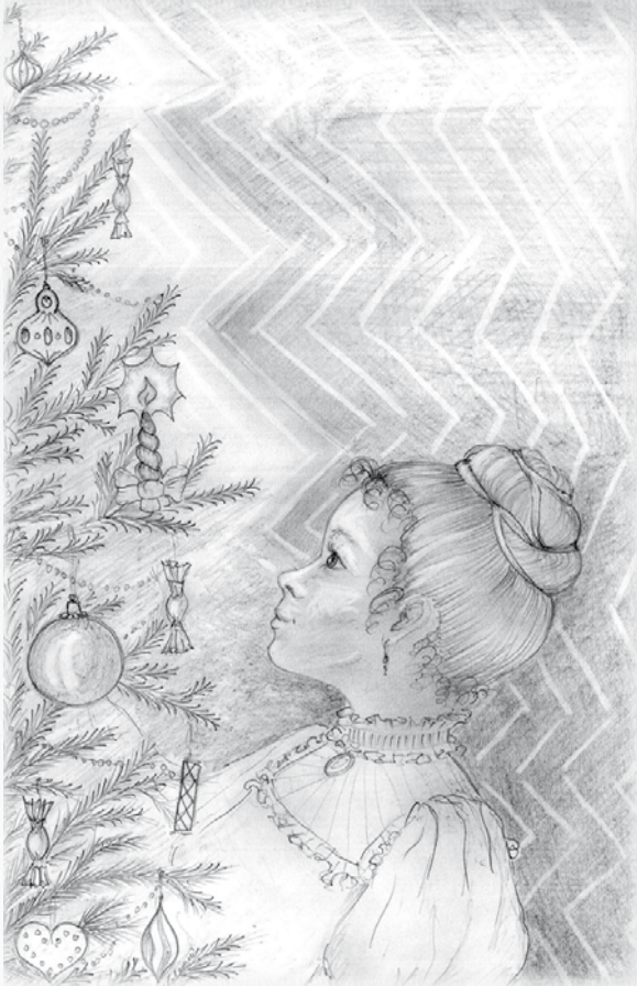
Rajz: Urbánné Kelemen Róza