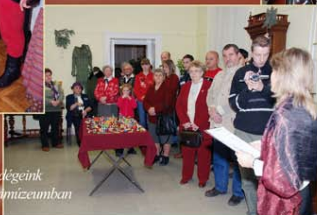
Makett-kiállítás és lengyel vendégeink „karácsonyi előzetese” a Macsmúzeumban