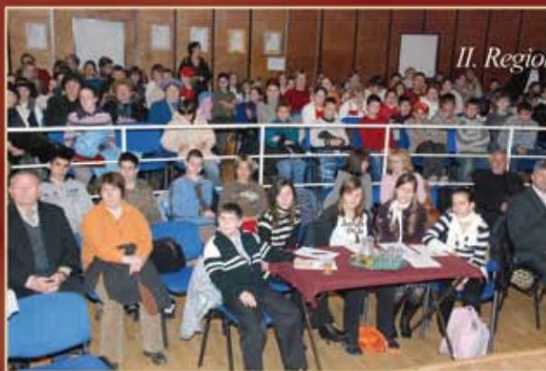
II. Regionális Kulturális Seregszemle Rákóczifalván