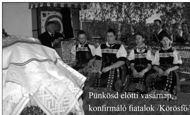
Pünkösdi előtti vasárnap, konfirmáló fiatalok /Körösfő/