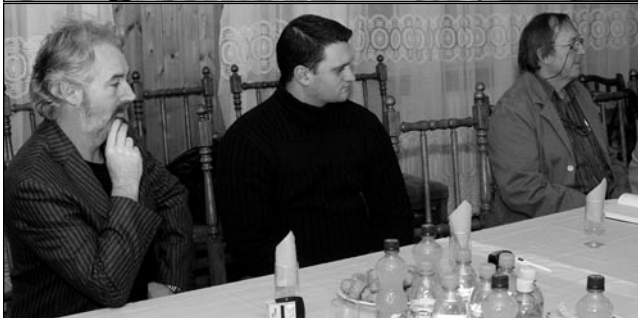
Akciócsoport ülés Kengyelen 2007. 01.30.