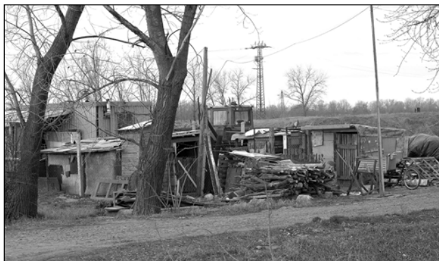
A „Tisza kapuja”, az út mindkét oldalán tárva, várva Pi.

Úgy tűnik, azért a múzeum nem ennyire durva elképzelés, a Tisza partja sem. A turizmust, mint gondolatot, idáig nem értették meg az itt élő vállalkozók sem, sőt a lényegét sem, hogy az az egységnyi pénzt, ami a faluban jelentkezik, nem növelhető csak külső vásárlóerő bevonásával. Akkor lehet számítani plusz bevételre. Igen, de egy ide érkező, vagy átutazó látja, és jogosan kritizálja, hogy az épületek és környezetük rendetlen, elhanyagolt, ami nem pénz kérdése, hanem igény.