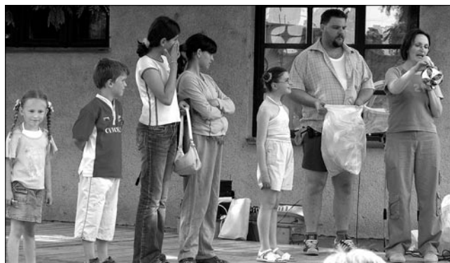
Gyermeknapon saját készítésű ajándékkal kedveskedtünk

Május elsején a főzőversenyre is beneveztünk, és bár