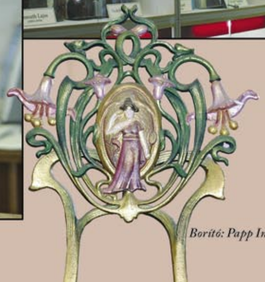
Borító: Papp Imre