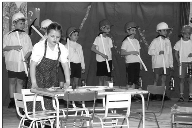
KI MIT TUD?