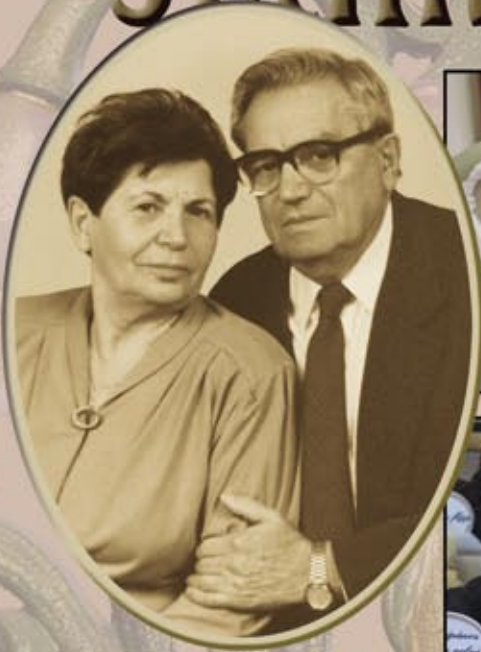
A gyökerek Rákóczi falváiáig érnek Hajdú Margit és Szamos Máttyás