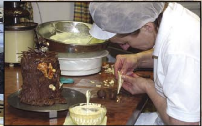
Marcipán múzeum, Szentendre