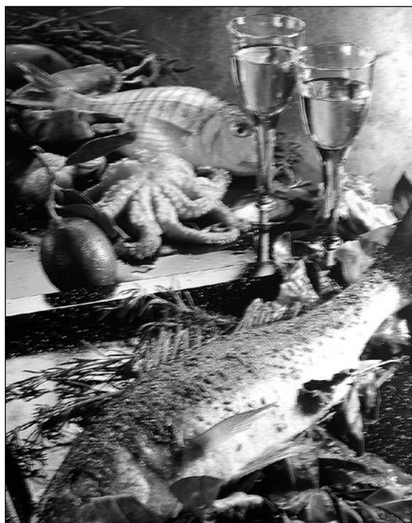
Nyári, tengerparti ételek