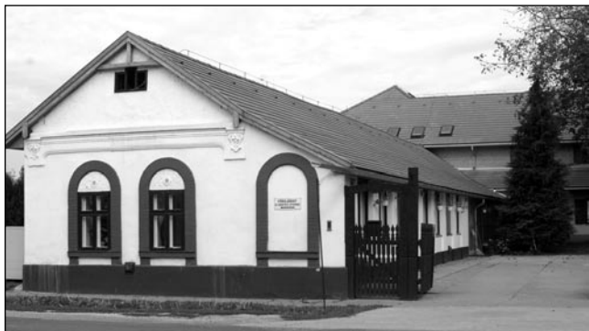
A Polgármesteri Hivatal pénztárában a segélykifizetések időpontjai 2007. évben

A Baptista Szeretetszolgálat mellett a nyáron a honvédség ajánlott fel jelentősebb mennyiségű tésztát. A közelmúltban pedig megalakult a településen a Létminimum Alatt Élők Társasága (LAÉT). A civil szervezet már 1200 kilogramm élelmiszert és 120 pár cipőt juttatott el a szegény sorsú családoknak. A segítségre szorulókat minden szerdán 10-12 óráig várják a civilszervezet tagjai, november 1-től a volt Tsz irodában (Indigó Kft.) osztják a segélyeket. Munkájukat az önkormányzat igyekszik megkönnyíteni, hiszen alkalmas helyiséget, és szükség esetén szállítóeszközt is biztosítanak a LAÉT-nek.