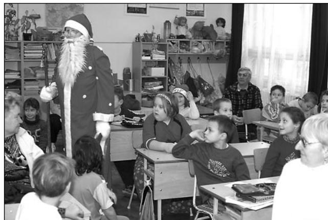
24 kisdíák számára készítettünk Mikulás-csomagot,